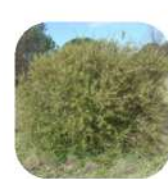
Filaires à feuilles étroites