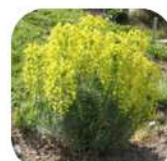
Euphorbe des garrigues