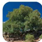
Erable de Montpellier