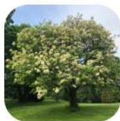
Frênes à fleurs