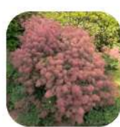
Arbre à perruque