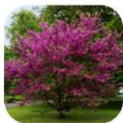
Arbre de Judée