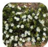
Ciste de Montpellier