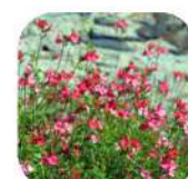
Sauge à petites feuilles

Chaque fin d'année, une résidence sera choisie pour l'implantation de la nouvelle forêt "Delt'Arboré".